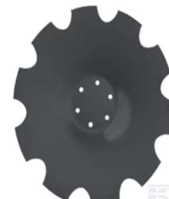
Déchaumeurs à disques

Pièces universelles Disques de déchaumeurs compacts