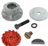
Accessoires de lames